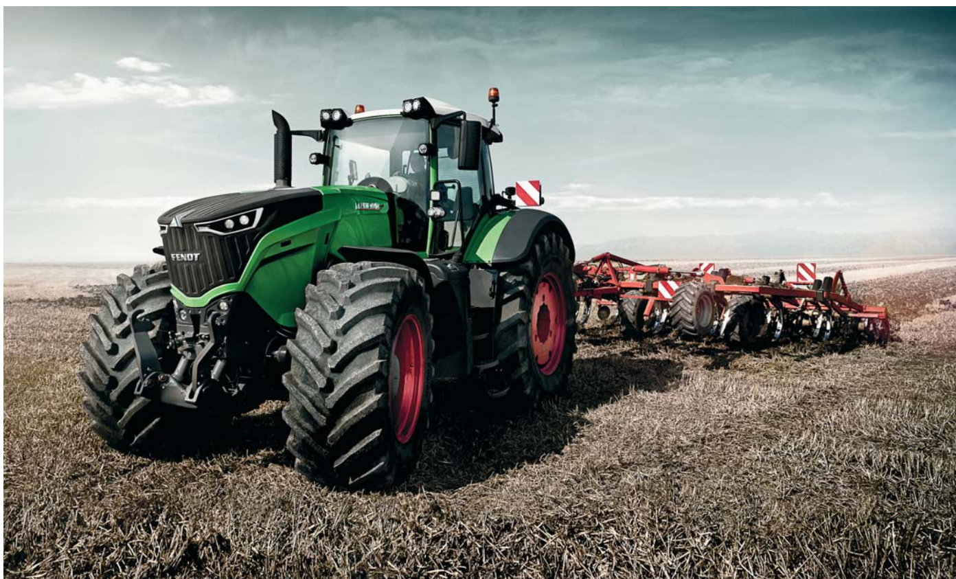
Fendt 1000 s maximálnym výkonom najväčšieho modelu 500 koní je revolucionár.