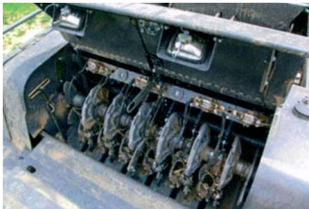
Sériový (!) tangenciálny ventilátor udržuje dvojitú uzlovače super čisté. Sériové je aj mazanie uzlovačov.

Ak sa 1290 S XD postaví na váhu, váži 11 650 kg. Aj preto sa sériovo vybavuje zosilnenou riaditeľnou tandemovou nápravou s kolesami s veľkosťou 500/45-22.5. Pneumatiky 620-ky už zvyšujú celkovú šírku na 3,21 m. Testovaný stroj mal povolenú maximálnu rýchlosť „len“ 50 km za hodinu, verzia XD môže byť aj pre rýchlosť 60 km za hodinu. V kombinácii s Fendtom 900 sa väčšie vzdialenosti stávajú malými. A keď sme pri traktore – stroj sa ovládal len prostredníctvom Vario terminálu. Pracova-