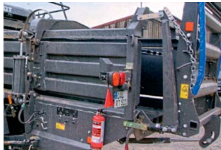
Vyhadzovač balíkov a sklzný žľab sa ovládajú vzadu. Váha je integrovaná do žľabu, merač vlhkosti je hore.