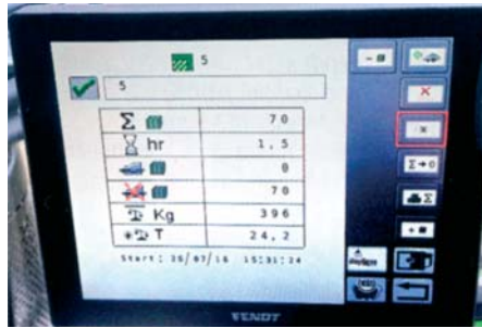
IsoBus kompatibilný lis sa ovládal Vario terminálom traktora – super!

lo to veľmi dobre, iba elektrické meranie dĺžky sa musí nanovo aktivovať.