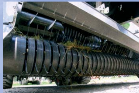
Zberacie ústrojenstvo (od prsta k prstu) je široké 205 cm, má štyri rady a sériový pridržovací valec.

né rady prstov zabezpečujú spolu so (sériovým!) pridriavacím valcom bezstratový zber malých radov sena, ako aj veľkých radov slamy. Vďaka úzkym neriadeným kopírovacím kolieskam (4.80/4.00-8) zostáva zberač v hraniciach troch metrov.