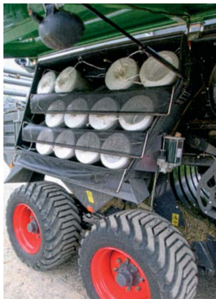
Vďaka ležiacim kĺbkám získava obsluha rýchly prehľad. 12 t hmotnosť stojí na tandemovej náprave s 500 mm širokými pneumatikami.