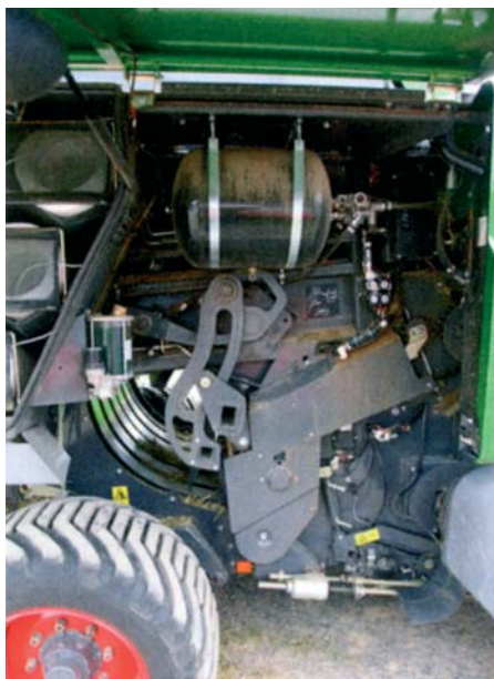
Systém s predkomorou sa osvedčil. Nastavenie zberača má ešte potenciál vylepšenia. Mazanie reťaze je sériové.