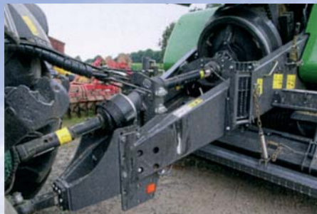
S dozadu posunutou guľou je obratnosť súpravy super. Čo ale chýba, je poriadny držiak hydraulických hadíc.

Iba pochvalu si zaslúži zberacie ústrojenstvo. Od krajného prsta ku krajnému prstu meria presne 205 cm a je vybavené istením trecou klznou spojkou. Štyri riade-