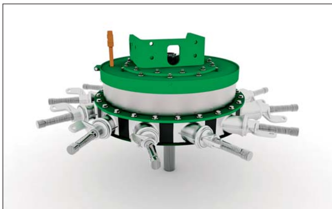
Zhrabovač Former 1255 X má elektrický integrovaný pohon rotorov. Výhodou je jednoduchosť konštrukcie, ušetrená hmotnosť, ideálna regulácia. Výrobca udáva aj zníženie spotreby oproti konvenčným strojom o 10 %.