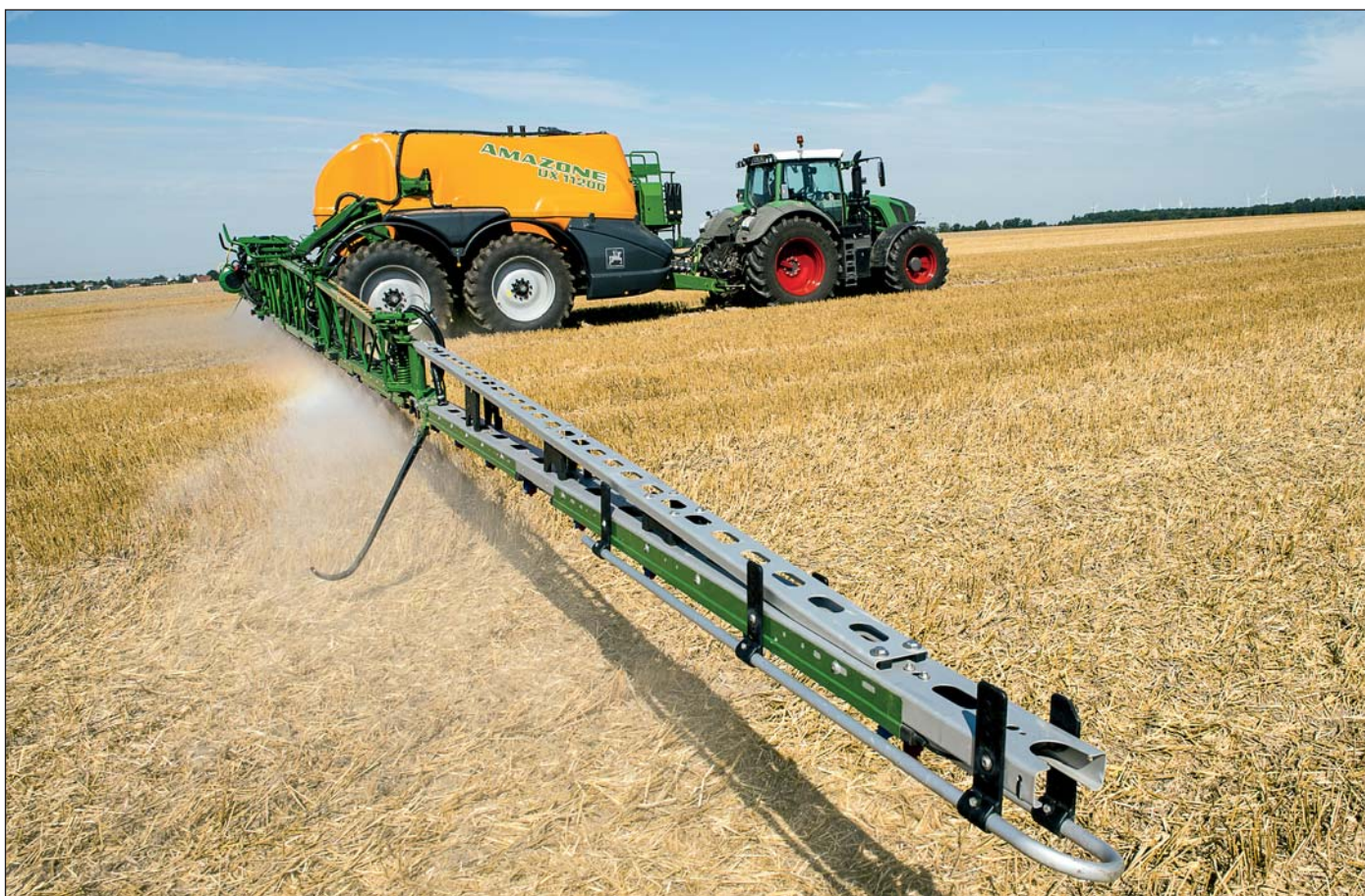
Vo Fendt Variotronic najnovšie viete riadiť sekčnú kontrolu postrekovačov, sejačiek či rozhadzovačov hnojív.

Novinkou je aj to, že C séria sa bude dodávať aj v horskej verzii ParaLevel s pohonom len prednej nápravy. Určená bude pre svahovitost