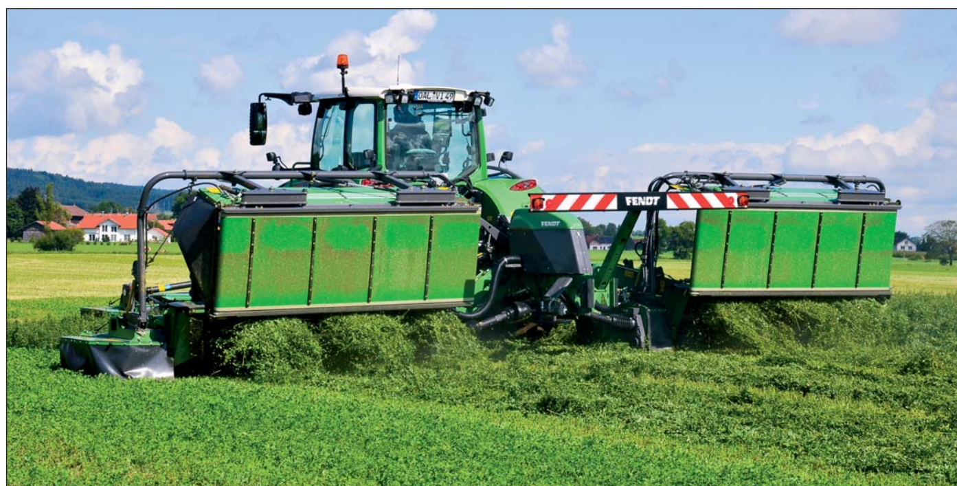
Full-line program Fendt. K lisom a rezačke pribudli aj žacie lišty, zhrabovače a obracače.