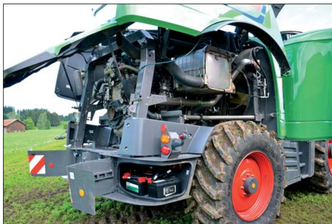
Katana 65 dostala nový MTU motor, ku ktorému je lepší prístup.

do 15%. V programe naďalej zostáva aj PL verzia s pohonom aj zadnej nápravy do svahovitosti 20%.