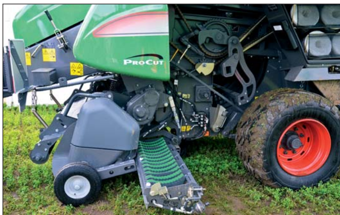
Rezačie ústrojenstvo na lisoch prešlo generačnou obmenou. Dá sa jednoducho vytiahnuť a dostalo aj väčší počet lepších nožov.