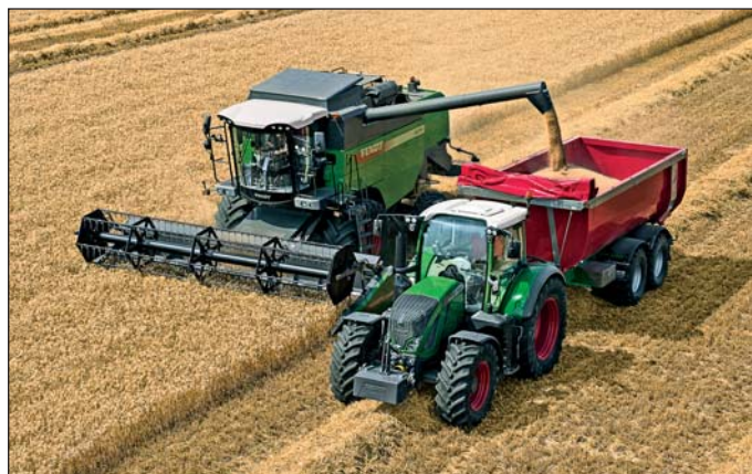
Najmenší kombajn Fendt E série prevzal mnohé prvky z vyšších radov a dizajnom (sivý zásobník a vyprázdňovacia závitovka) sa zaradil do rodiny ostatných radov. Okrem nového motora dostal aj komfortné prvky ovládania.

ších farmárov, ktorí chcú nový a spoľahlivý kombajn. Tým, že prebral mnohé prvky z vyššej C série (mlátiace ústrojenstvo či vytriasadlá), sa stáva spoľahlivým a robustným strojom aj na 20 rokov prevádzky.